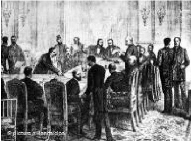
Wettlauf um Afrika auf der Kongo-Konferenz

Es ist ein dunkles Kapitel europäischer Geschichte: Vor 125 Jahren kamen die Kolonialmächte der damaligen Zeit in Berlin zur so genannten "Kongo-Konferenz" zusammen. Die Aufteilung Afrikas sollte dabei zementiert werden.