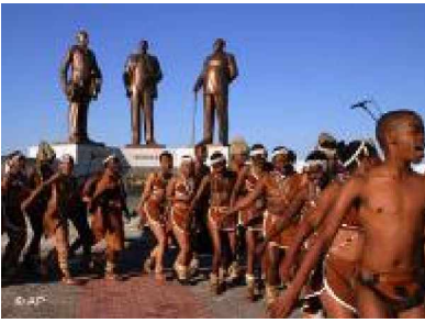
Die Unabhängigkeit wird auch heute groß gefeiert

Nach dem Zweiten Weltkrieg wollten sich die Menschen in den Kolonien nicht mehr mit der Herrschaft der Europäer abfinden. Die Kolonialmächte bekannten sich daheim zu den Prinzipien Freiheit, Gleichheit und Brüderlichkeit. Das forderten nun auch die Afrikaner –und läuteten damit den Anfang vom Ende des Kolonialsystems ein. Die Dekolonisation Afrikas verlief viel schneller als die Europäer sich das zunächst vorgestellt hatten. Allein im Jahr 1960 wurden 17 vor allem westafrikanische Länder in die Unabhängigkeit entlassen. Kurz darauf zogen sich die Kolonialmächte auch aus Ostafrika zurück.