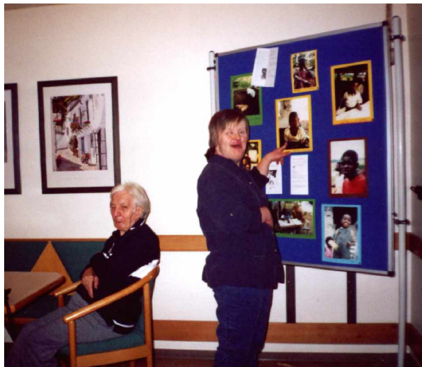
Fotoausstellung in den Baunataler Werkstätten