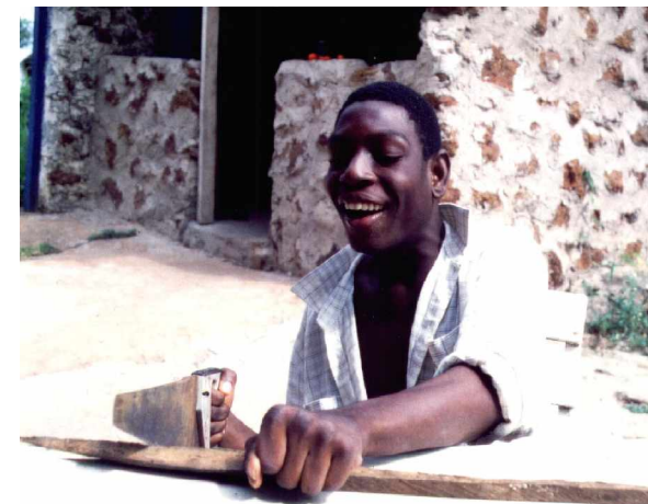
Kojos Vorbereitung aufs Berufsleben

Im vergangenen Jahr ist die Zahl der Kinder im Wohndorf von 21 auf 25 angewachsen. Daher braucht das Projekt immer noch Patenschaften, um die Ausgaben für Nahrung, Kleidung, Betreuung und medizinische Versorgung zu decken.