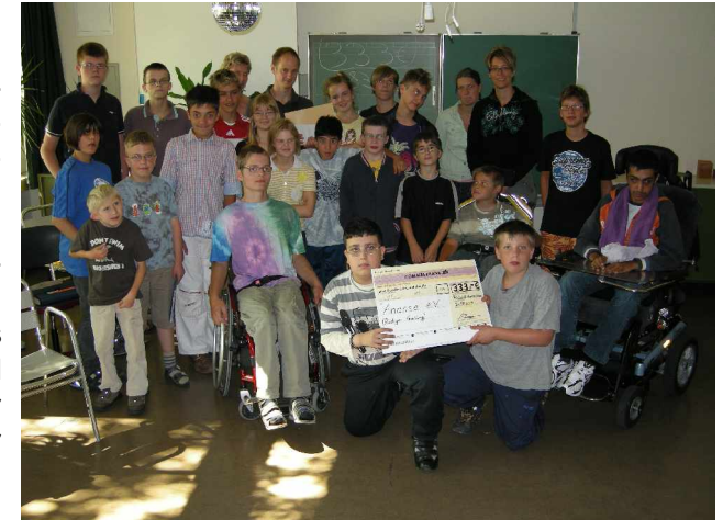
Schüler überreichen 333 Euro für Ananse-Projekt

Drittens freute uns die Unterstützung, die wir von so vielen Seiten erhalten haben: Zum Beispiel sammelten Schüler der Albatros-Schule, einer Förderschule in Bielefeld, durch verschiedene Aktionen und einen großen Flohmarkt für das Ausbildungszentrum in Wenchi. Die Ver-