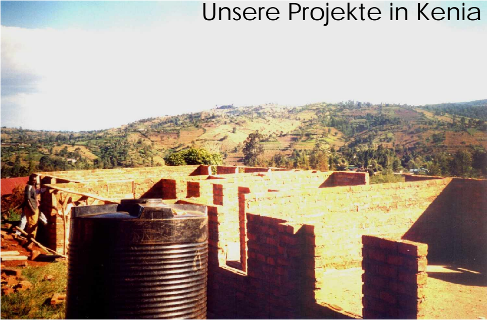
Baustelle für das Förderzentrum in Kapsowar