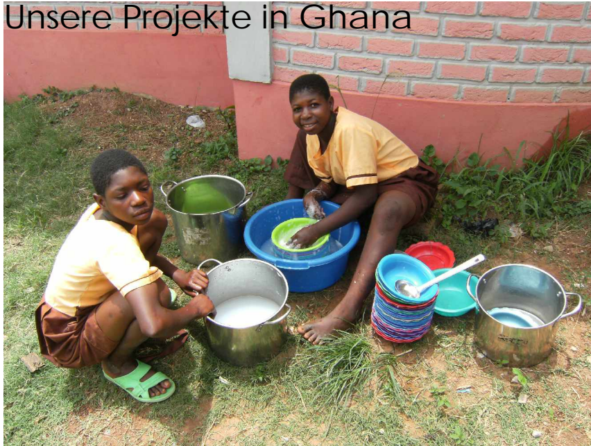
Abwasch an der Shalom Special School